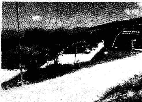
Abruzzo: in alto immobili danneggiati a Pienze; al centro i moduli abitativi donati dalla Fondazione De Agostini, e il cartello di "Via Novara". Sotto automezzi e tende