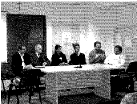
Il tavolo dei relatori

DIC 5 Pubblicato da Radio City - Vercelli, Biella, Novara