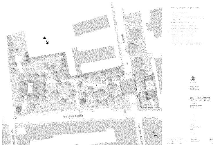
La planimetria generale della nuova piazza

C'è un cuore verde nel futuro del quartiere Sant'Andrea