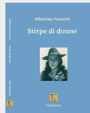
STIRPE DI DONNE di Albertina Fancetti EDB Edizioni