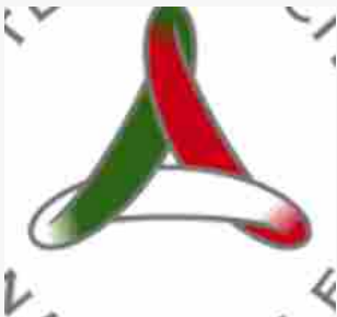
IL BOLLETTINO DELLA PROTEZIONE CIVILE - 2