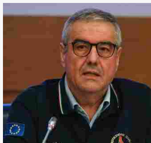
IL BOLLETTINO DELLA PROTEZIONE CIVILE - 1