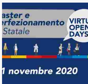
Al via la seconda edizione del “Master in Digital humanities”