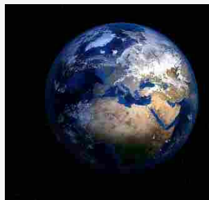
BREVI DAL MONDO