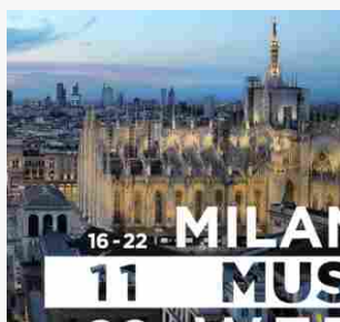
“Milano Music week”