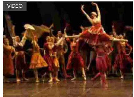
Torna il grande balletto con Teatro Arcimboldi e La Scala