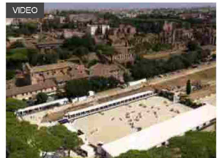
Longines Global Champions Tour, a Roma successo mondiale