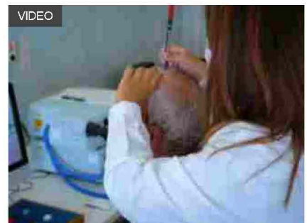
AirAlzh: speranze dalla ricerca sull'Alzheimer