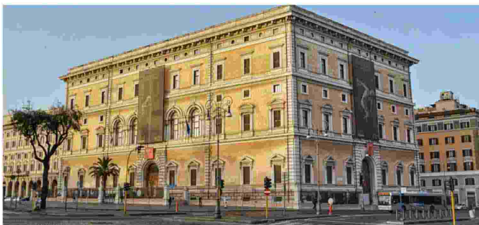
Palazzo Massimo a Roma

Il percorso di visita viene riproposto anche nelle speciali guide accessibili di Museo per tutti : la guida racchiude tutte le informazioni utili per accedere al museo, spostarsi al suo interno, poter usufruire dei servizi e delle brevi schede per permettere ai visitatori e ai loro accompagnatori di familiarizzare in anticipo con le opere e con gli spazi museali. Grazie alla guida la persona con disabilità può vivere un'esperienza di benessere all'interno del Museo svolgendo la visita in autonomia o con il suo accompagnatore (genitore, insegnante, educatore) senza stress e insieme a tutti gli altri visitatori. Il lavoro di redazione viene realizzato dal personale dei servizi educativi del museo che partecipa a tutte le fasi della sua realizzazione: dalla creazione del percorso di visita alla scelta delle opere o dei luoghi da inserire. Le guide sono redatte nel cosiddetto "Easy to read" , un linguaggio facilitato codificato e regolamentato dall'Unione Europea e sono adatte a essere utilizzate sia da bambini sia dagli adulti.