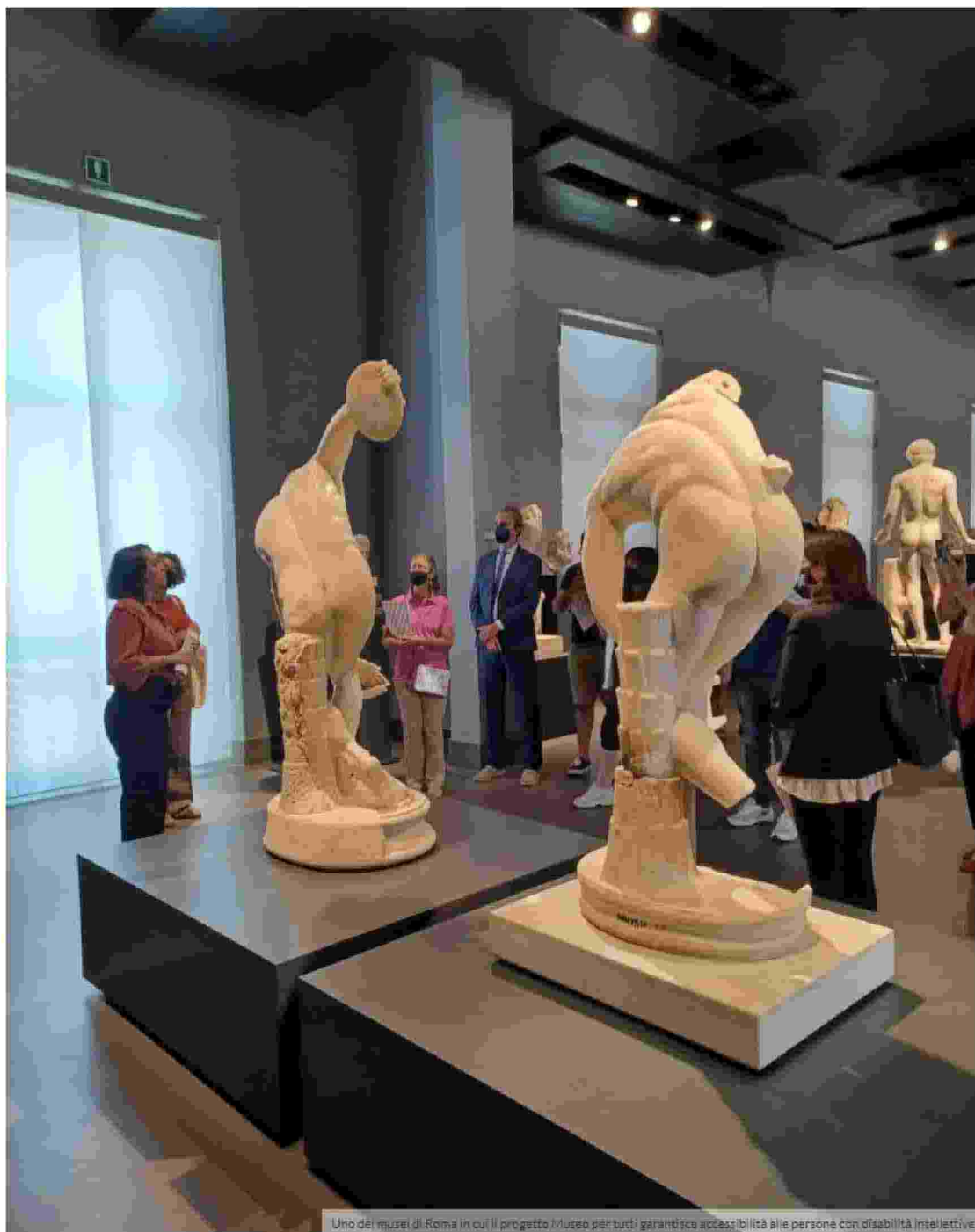
Uno dei musei di Roma in cui il progetto Museo per tutti garantisce accessibilità alle persone con disabilità intellettive.

EDITORIALI FATTI PERSONE VISIONI DA VEDERE CHI SIAMO